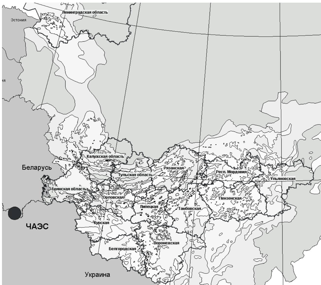
Рис. 1. Карта загрязнения цезием-137 территорий Российской Федерации вследствие аварии на Чернобыльской АЭС

В ряду защитных мероприятий в начальный период после аварии существенную роль сыграла йодная профилактика населения и особенно детей. К сожалению, своевременная йодная профилактика была проведена лишь в г. Припять, где до момента эвакуации более 60% жителей приняли препараты йода. Существенная задержка в принятии решения о проведении йодной профилактики, позднее оповещение и обеспечение населения препаратами стабильного йода, отсутствие йодной профилактики в сельских населенных пунктах являются горькими уроками аварии на Чернобыльской АЭС, которые должны быть учтены в дальнейшем при совершенствовании мероприятий по обеспечению защиты населения в условиях радиационных аварий.